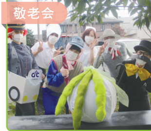
職員が「大きなカブ」の劇を披露！本格的な衣装も見どころ。