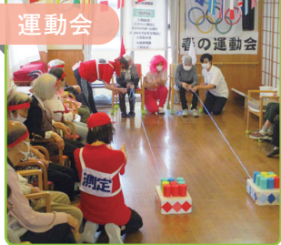
利用者様が競技に参加。みんなで白熱して盛り上がります！