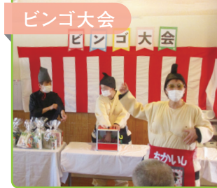
年末恒例のビンゴ大会は、会場に「ビンゴ！」の声が響きました。